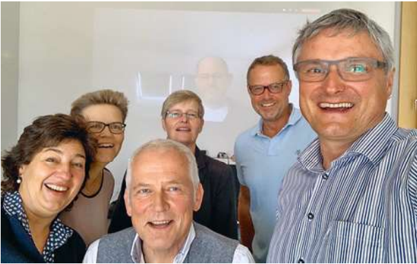
Das gfo-Vorstandsteam freut sich über seine Wiederwahl