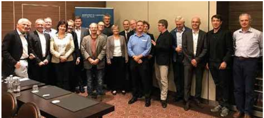
Strahlende Gesichter auf der Mitgliederversammlung